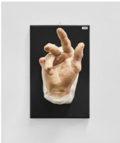
Adolf Fleischmann, Nr. 133, Dupuytren'sche Kon- traktur rechts (Bursitis PIP Kleinfinger), (zw. 1917– 1927), Wachsmischung, Stoff auf Holz, 17 x 26 x 14,5 cm, Foto: Bernhard Strauss © Moulagenmuseum der Universität und des Universitätsspitals Zürich