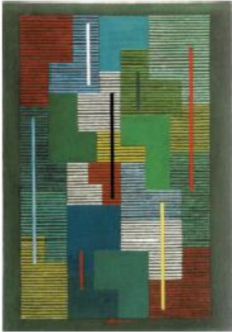
Adolf Fleischmann, Composition en vert , 1950, Öl auf Rupfen, 92,5 x 65 cm, Museum für Konkre- te Kunst, Ingolstadt