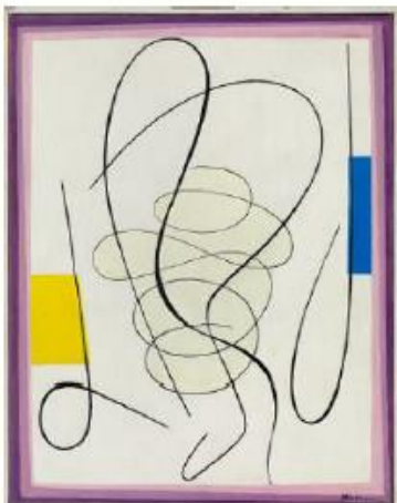
Adolf Fleischmann, Ohne Titel (Nr. 5 Helle Kurven), ohne Jahr (um 1949),

Öl auf Leinwand, 95 x 76 cm, Privatbesitz,