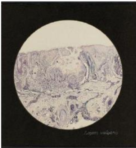
Adolf Fleischmann, Lupus vulgaris, (zw. 1917– 1927), Tusche auf Papier, 14,5 x 14,5 cm