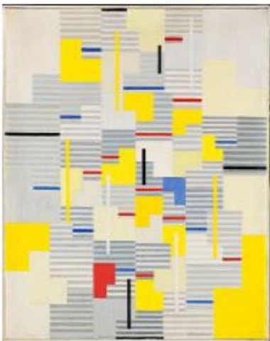
Adolf Fleischmann, #39a , 1955, Öl auf Leinwand, 99 x 81 cm, Privatbesitz, Foto: Bernhard Strauss © Nachlass Adolf Fleischmann