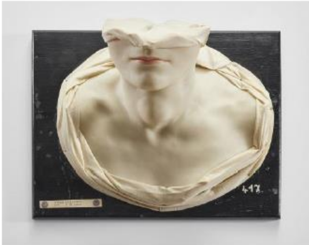
Adolf Fleischmann, Moulage Nr. 417 Diagnose „Struma recidivans“, (zw. 1917–1927), Wachsmischung, Stoff auf Holz, 40,5 x 31 x 25 cm